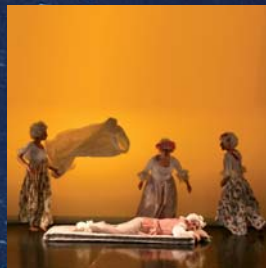
© Alte - Cie Poussières d'Étoiles